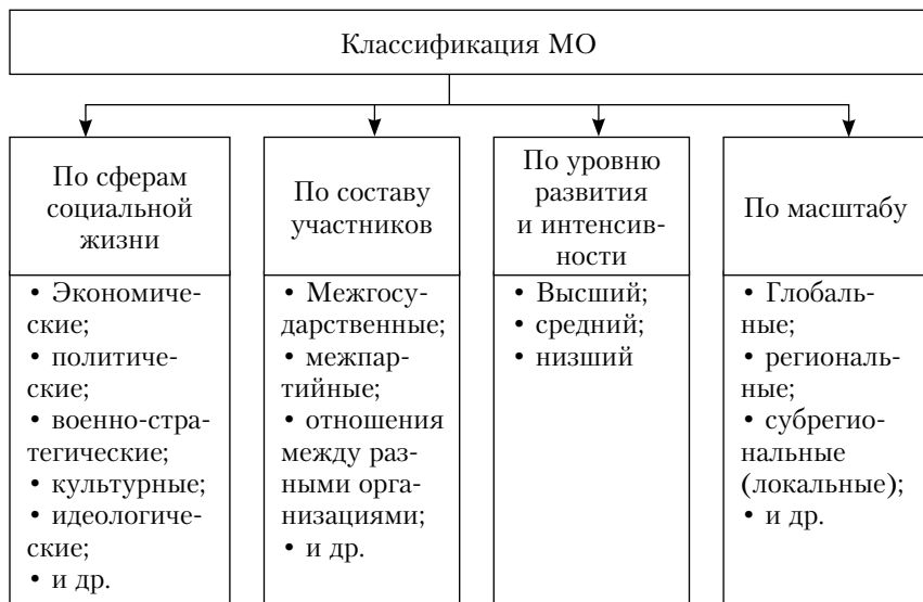
Рис. 1.2. Классификация международных отношений

Остановимся несколько подробнее на подходах и парадигмах, участвующих в исследованиях международных отношений.